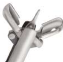
Ovale Löffel mit Dorn