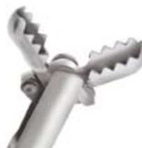
Gezahnnte ovale Löffel