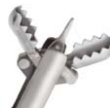
Gezahnnte ovale Löffel mit Dorn